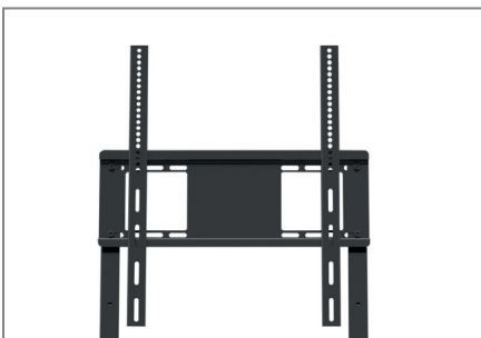
VESA-Aufnahme, max. VESA 400 x 600 mm