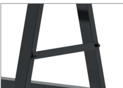
Feststellbare Querstreben bringen Stabilität