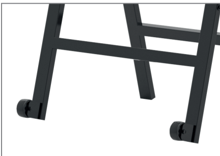
Dank integrierter Rollen leicht zu bewegen