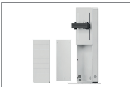
Einfache Montage durch herausnehmbare AV-Montageplatte