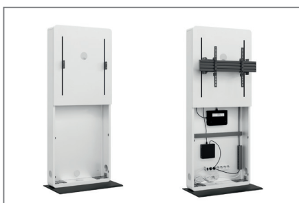
AV-Zubehör findet im Inneren problemlos Platz