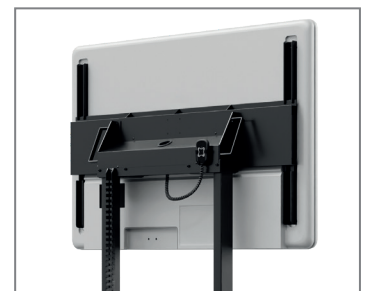
Kabelführung mittels Energieführungskette