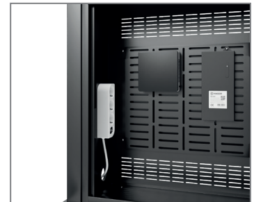
inkl. Mehrfachstecker & AV-Montageplatte