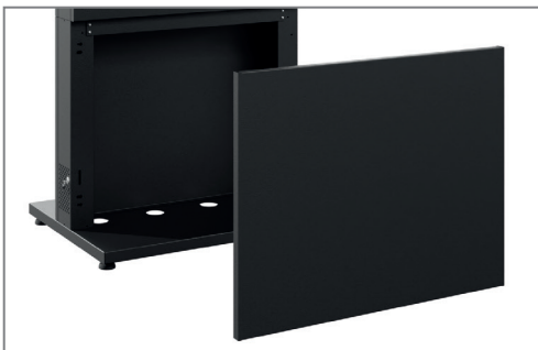
Abnehmbares Frontcover für gute Servicezugänglichkeit

Durch Zusatzoptionen lässt sich die Stele zudem für den gewünschten Einsatzort individuell anpassen.