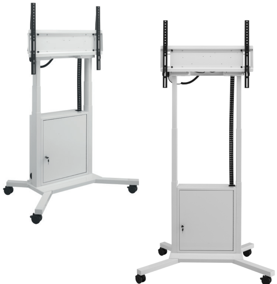
Technische Änderungen vorbehalten