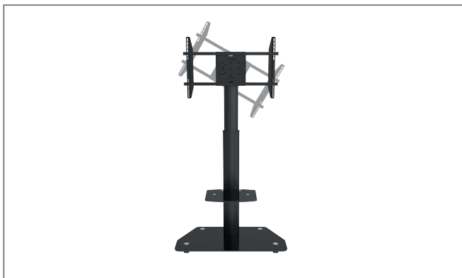
nutzbar mit HP-Stand 55 (Art.-Nr.: 9425)