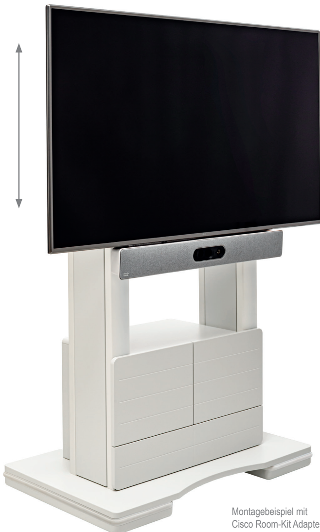
Montagebeispiel mit Cisco Room-Kit Adapter