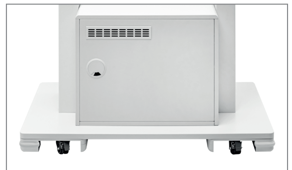
Rückansicht, feststellbare Transportrollen, Belüftungsgitter