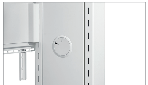
Höhe des Bildschirms wählbar in Raststufen (montageseitig)