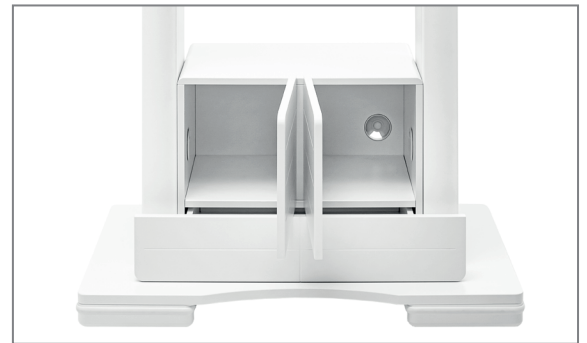
Gut strukturierter, belüfteter Stauraum für Medientechnik

Optional sind Kamera- und Soundbarhalterungen erhältlich.