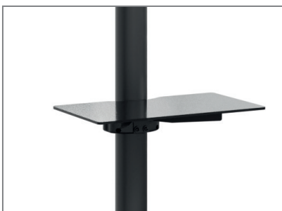
Optional: Braclabs-Stand Frontshelf (Art.-Nr.: 1984)