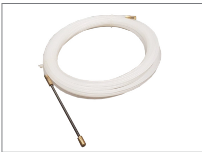
inkl. praktischer Kabeldurchzugshilfe

Alternativ zum Braclabs-Stand Floorbase ist auch eine mobile Variante (Art.-Nr.: 1983) und eine Variante zur Bodenmontage (Art.-Nr.: 1982) verfügbar.