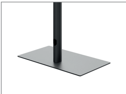
asymmetrische Bodenplatte erlaubt eine Positionierung nah an der Wand