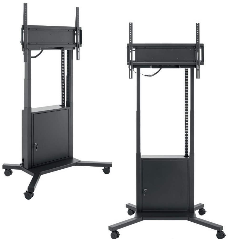
Technische Änderungen vorbehalten