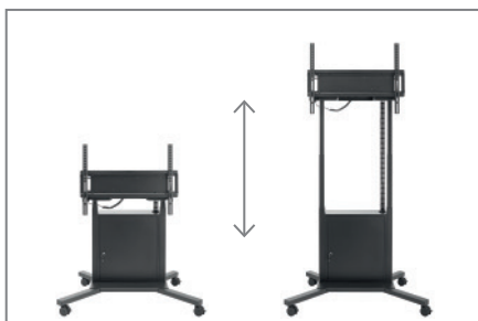
978 mm Fahrweg

Optional steht eine höhenverstellbare Kameraaufnahme (Lift Pro Camera Holder Black - Art.-Nr.: 8902) zur Verfügung.