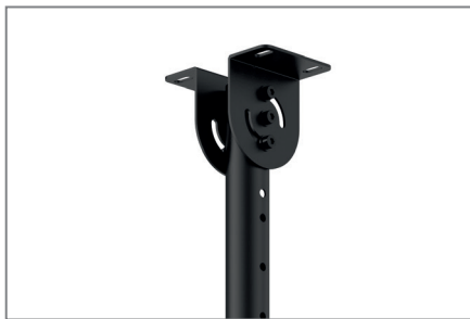
Neigungsmodul, stufenlos, 0 - 90°