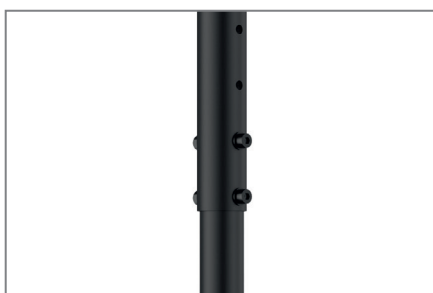
teleskopierbar bis max. 3000 mm