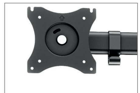
VESA 75 x 75 und 100 x 100 mm