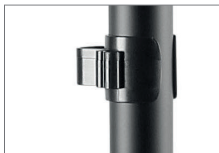
Kabelführung über Kabelclips