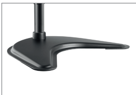
Sehr pflegeleicht dank schlag- und kratz-fester Pulverbeschichtung in schwarz