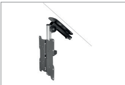
auch für Dachschrägen geeignet