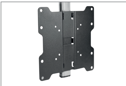
VESA min. 75 x 75 bis max. 200 x 200 mm