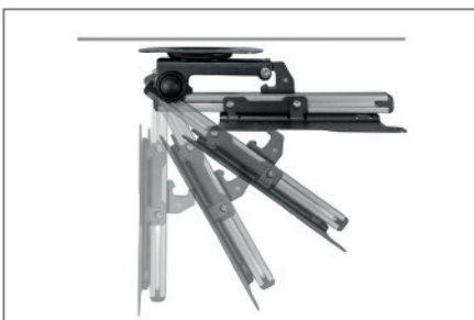
platzsparendes einklappen der Halterung