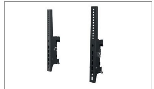
VESA-Arme, neigbar, max. VESA 400 mm