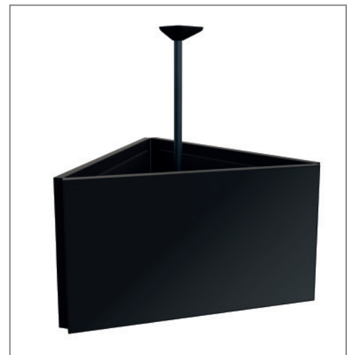
Bildschirmcontent rundherum sichtbar