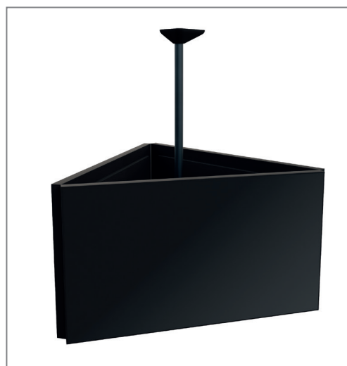
Bildschirmcontent rundherum sichtbar