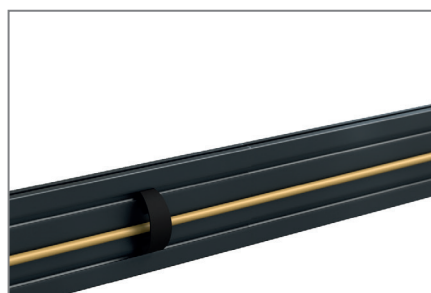
Kabelmanagement entlang der Rails