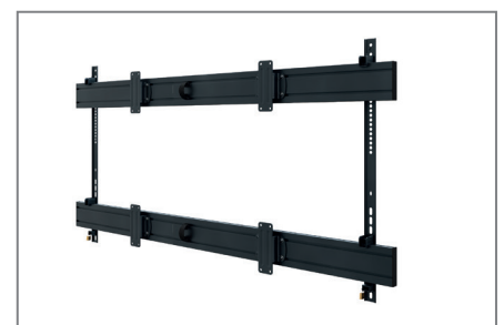
Anpassbar dank modularer Bauweise