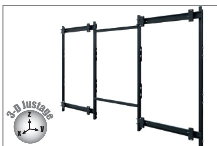
Feinjustierung auf drei Achsen möglich