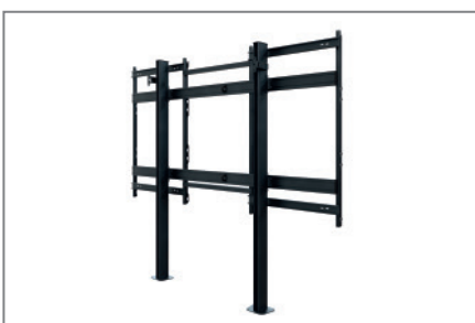
geringer Platzbedarf dank Boden Wand Montage