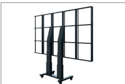
Kein Fineadjustment notwendig