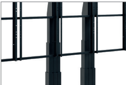
Motorisch höhenverstellbar - 700 mm Hub

Neben den vorkonfigurierten Systemen bietet HAGOR kundenspezifische Sonderlösungen im LED-Bereich an, welche abgestimmt auf alle Bedürfnisse mit Zubehör wie z. B. Lautsprechern, Steuerungen etc. individualisiert werden können.