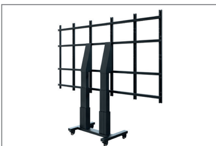
Kein Fineadjustment notwendig