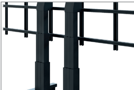
Motorisch höhenverstellbar - 700 mm Hub

Neben den vorkonfigurierten Systemen bietet HAGOR kundenspezifische Sonderlösungen im LED-Bereich an, welche abgestimmt auf alle Bedürfnisse mit Zubehör wie z. B. Lautsprechern, Steuerungen etc. individualisiert werden können.