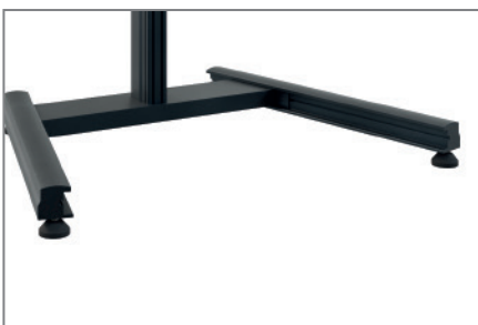
feinjustierbare Stellfüße für präzise Ausrichtung