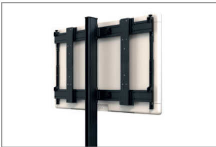
Rückseitige Kabelführung entlang der Rails