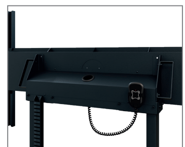
Kabelführung mittels Energieführungskette