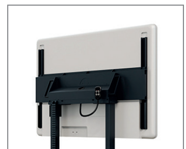
Displayspezifisch optimierte TV-Aufnahme