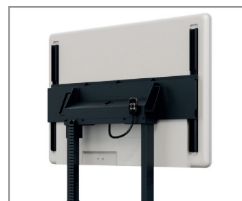
Displayspezifisch optimierte TV-Aufnahme