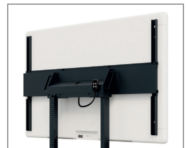
Displayspezifisch optimierte TV-Aufnahme