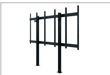
geringer Platzbedarf dank Boden Wand Montage