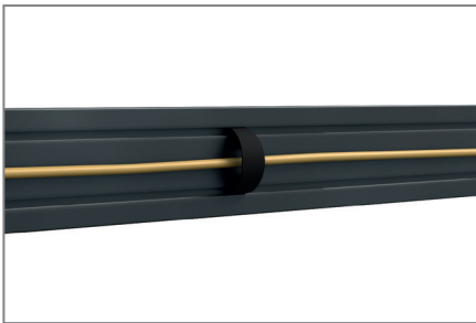
Kabelführung mittels Clips

Die voll kompatiblen Komponenten lassen sich bei Bedarf erweitern.