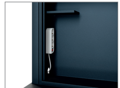
Medienschränk mit Mehrfachstecker und Ablage