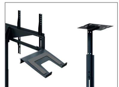
erweiterbar mit Laptop- / Kamera-Aufnahme