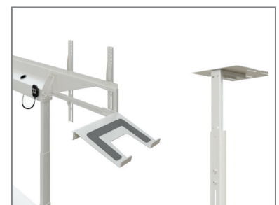
erweiterbar mit Laptop- / Kamera-Aufnahme