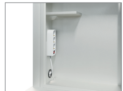
Medienschränk mit Mehrfachstecker und Ablage