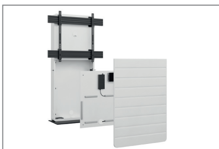
Einfache Montage durch herausnehmbare AV-Montageplatte