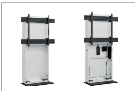
AV-Zubehör findet im Inneren problemlos Platz