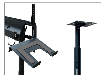
erweiterbar mit Laptop- / Kamera-Aufnahme