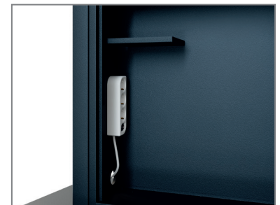
inkl. Mehrfachstecker und Ablage