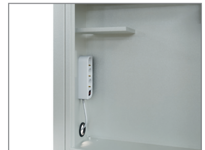
inkl. Mehrfachstecker und Ablage