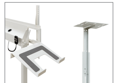
erweiterbar mit Laptop- / Kamera-Aufnahme