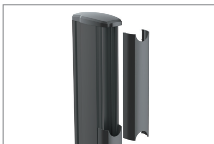
Rückseitige Kabelführung entlang des Pillar