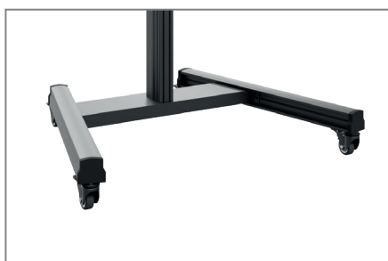
Mobil, dank Rollenset mit Feststellbremse