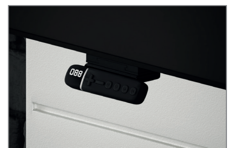
Tastschalter mit 4 individuellen Speicherplätzen