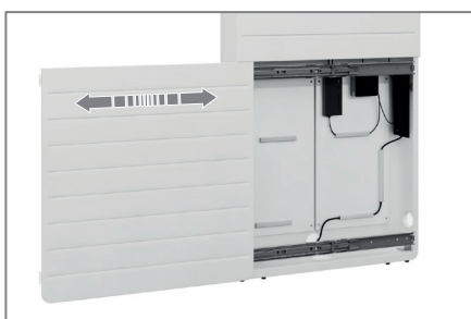
AV-Zubehör findet im Inneren problemlos Platz