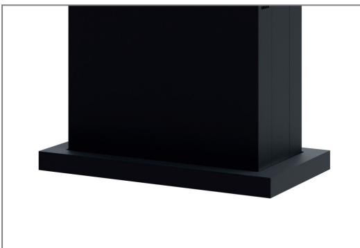
Sauberer Bodenabschluss dank umlaufender Blende