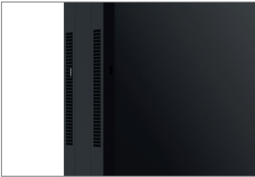
Displayspezifisch angepasst, z.B. Belüftung, Infrarotsensor

Die Oberfläche der Stelen ist mit einer korrosionsbeständigen, hochwetterfesten Kunststoffpulverbeschichtung in schwarz (RAL 9005) veredelt.