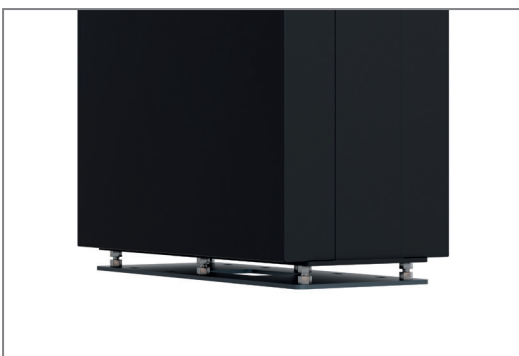
Bodenbefestigung inkl. Niveaueinrichtung