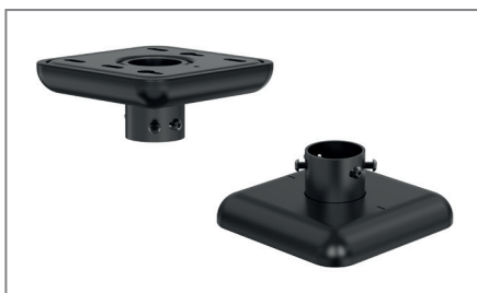
Sauberer Decken- und Bodenabschluss