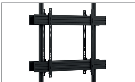
Montageseitig höhenverstellbar entlang der Poles