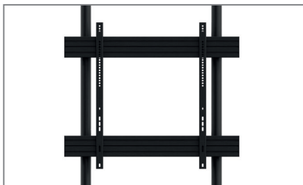
VESA, min. 200 x 200 mm - max. 900 x 800 mm