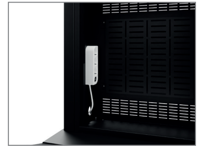
inkl. Mehrfachstecker & AV-Montageplatte