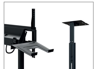
erweiterbar mit Laptop- / Kamera-Aufnahme