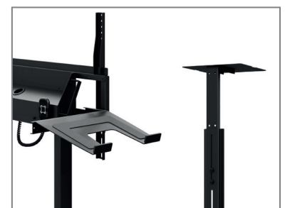
erweiterbar mit Laptop- / Kamera-Aufnahme