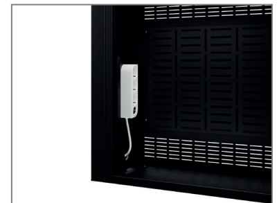
inkl. Mehrfachstecker & AV-Montageplatte