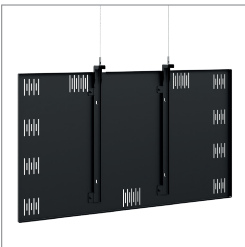
Rückabdeckung und Aufnahme